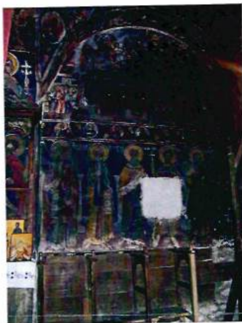
Άποψη του εικονογραφικού προγράμματος του νάρθηκα