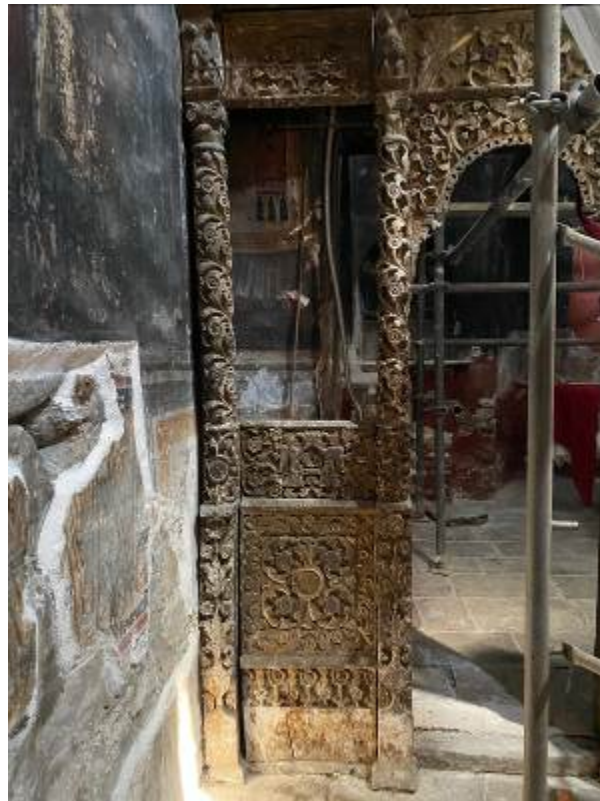
Το κατώτερο τμήμα του τέμπλου του Ι. Ναού