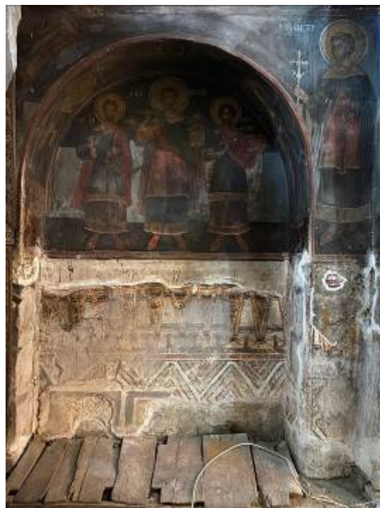
Άποψη του εικονογραφικού προγράμματος στο Νότιο τοίχο