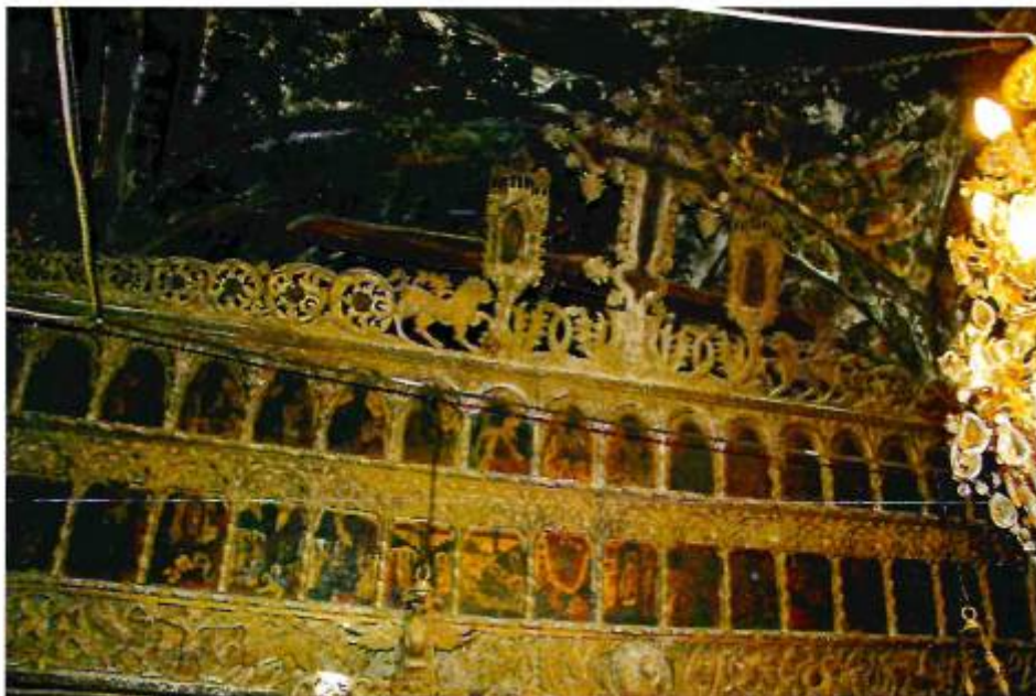
Το ανώτερο τμήμα του τέμπλου του Ι. Ναού