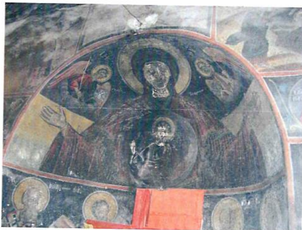
Η κόγχη του Ιερού Βήματος