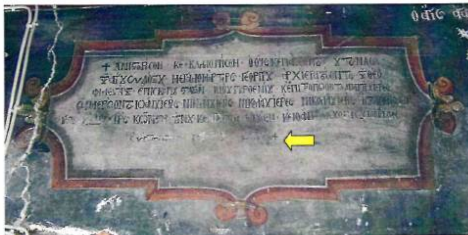
Επιγραφή 2 ης εικονογραφικής φάσης του Ναού