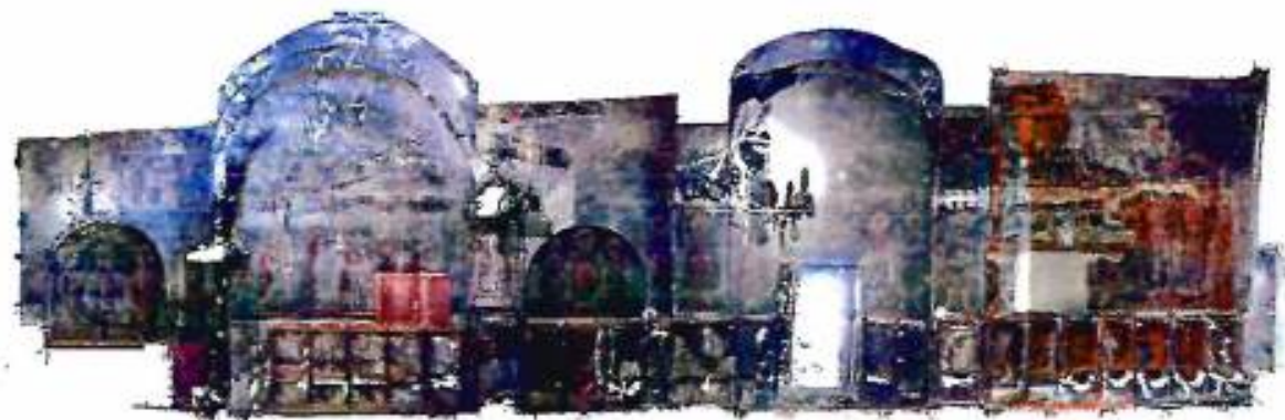
Νότιος τοίχος όπως αυτός αποτυπώθηκε με τη χρήση 3D Scanner