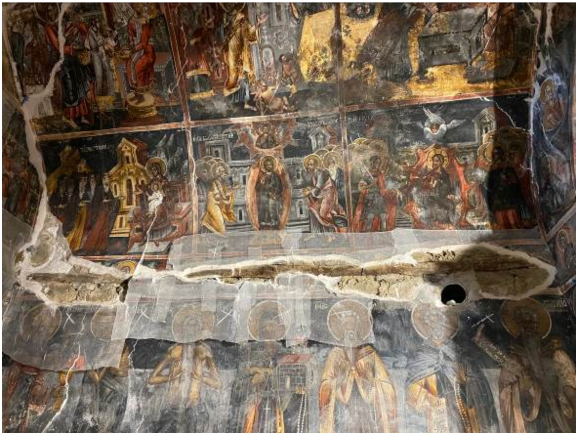
Άποψη του εικονογραφικού προγράμματος στον κυρίως Ναό