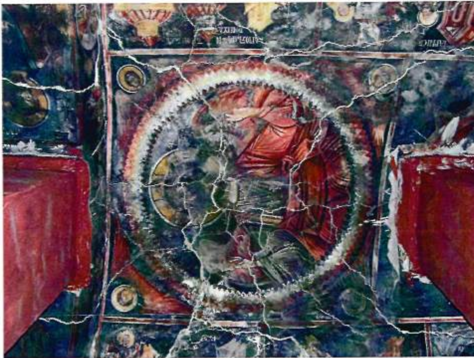
Άποψη των μεταγενέστερων πεσσών που κατασκευάστηκαν για τη στήριξη του τρούλου