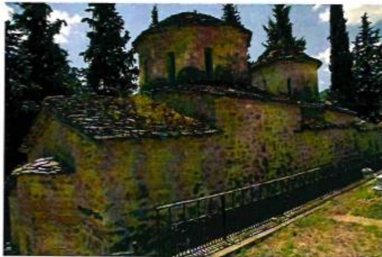
Ιερός Ναός Αγίου Γεωργίου Οξύνειας