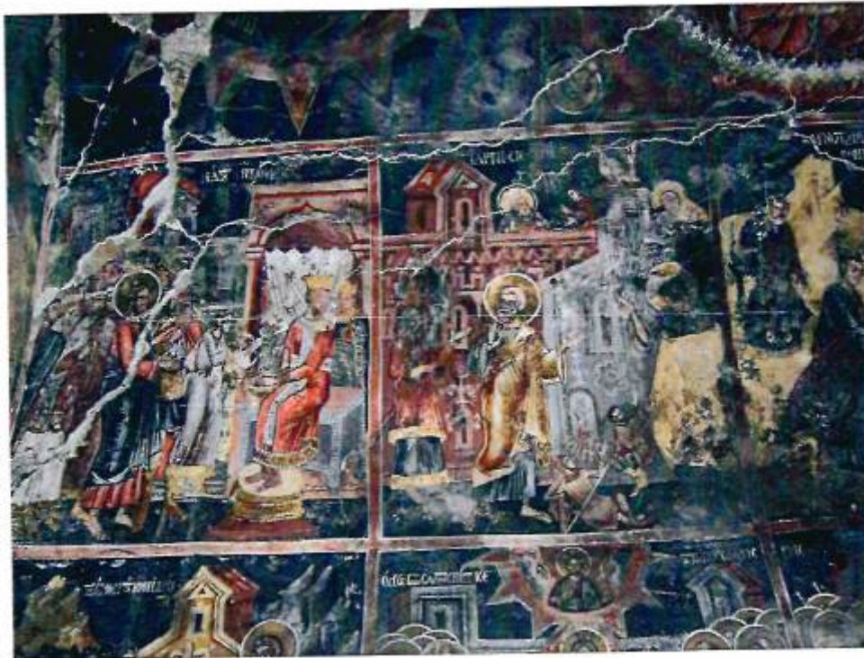
Άποψη του εικονογραφικού προγράμματος του εξωνάρθηκα