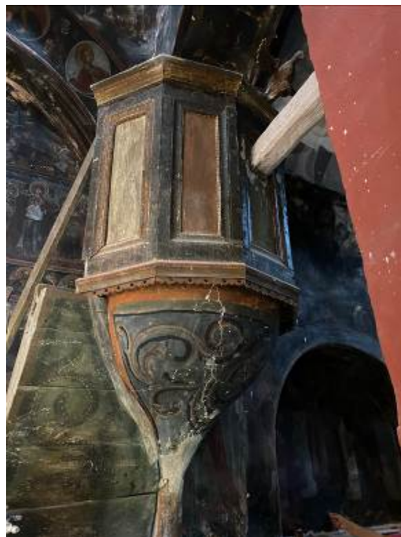
Ο Άμβωνας του Ι. Ναού