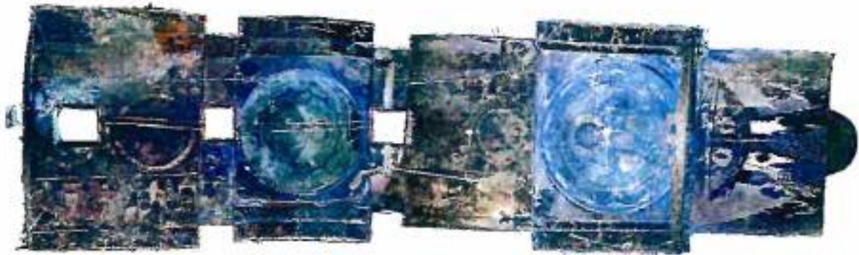
Άνοψη του Ναού όπως αυτή αποτυπώθηκε με τη χρήση 3D Scanner